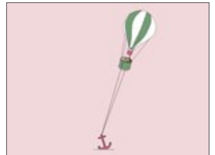
Freiheitlich-Demokratische Grundordnung © Großstadtzoo

Wer sich beteiligen will, muss die Spielregeln kennen. Das fängt beim Zeitunglesen an und reicht bis zur Kandidatur für ein politisches Amt. Oft begegnen einem dabei Begriffe, die sich nicht selbst erklären. Die Ausstellung „Grundbegriffe der Demokratie“ erklärt die wichtigsten Ämter, Prinzipien und Begriffe des demokratischen Systems. Farbenfrohe Illustrationen und Bilderrätsel laden zum Um-die-Ecke- und Weiterdenken ein. Ergänzt werden sie von praktischen Beispielen, die zeigen, wo sich direkte Demokratie oder der Rechtsstaat auch in Ihrer Nachbarschaft auswirken.